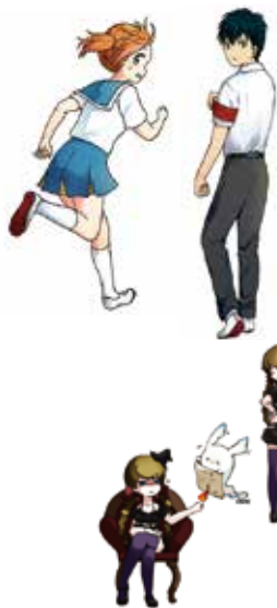
キャラクターデッサン