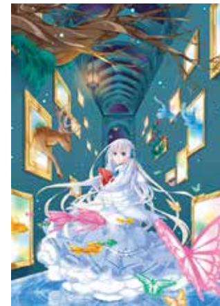
イラストレーション