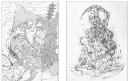
ドローイング (本作品のための)