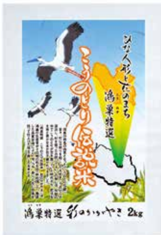
パッケージデザイン